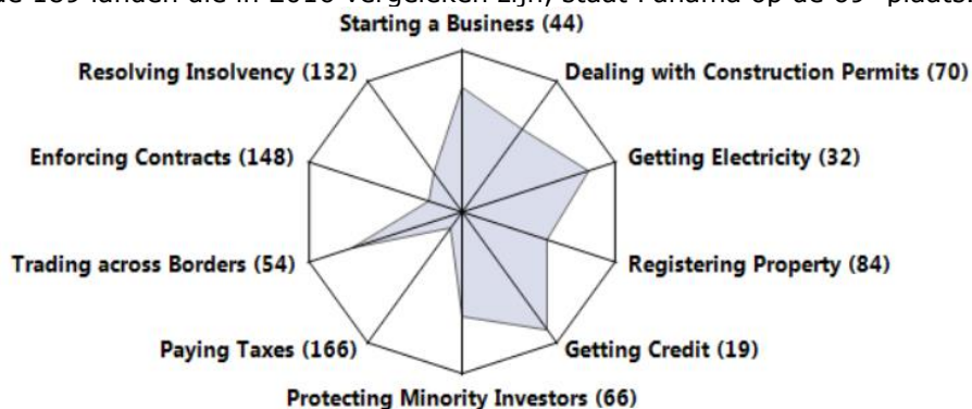
Figuur 2: Panama's ranking per factor (Doing Business 2016)

Voordat men begint met zaken doen en/of vestigen van een bedrijf in Panama is het goed om een aantal praktische zaken uit te zoeken. Jaarlijks brengt de Wereldbank per land een rapport uit waarin the ease of doing business wordt beschreven aan de hand van de 10 onderstaande factoren en de factor regulering van de arbeidsmarkt . Van de 189 landen die in 2016 vergeleken zijn, staat Panama op de 69 e plaats.